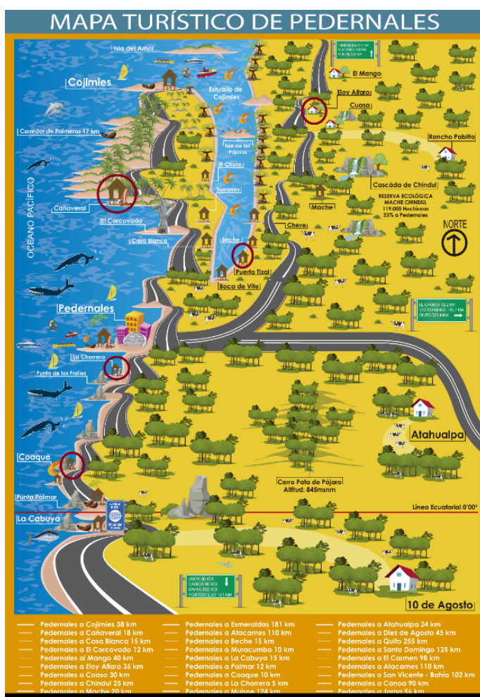
Figura 4. Mapa turístico del cantón Pedernales.

El proyecto de la ruta gastronómica para fortalecer el turismo en el cantón Pedernales, se desarrollará en las siguientes comunidades que se pretende atender, Coaque, La Chorrera, Cañaveral, Puerto Tizal y Eloy Alfaro de acuerdo con la encuesta realizada a los visitantes locales y externos; esta ruta une dos parroquias: parroquia rural Cojimíes y parroquia urbana-periférica Pedernales. Como se muestra en la figura 4.