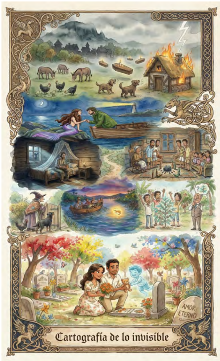
Cartografía de lo invisible